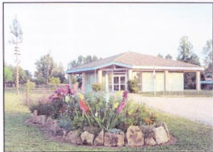
Une mairie fleurie